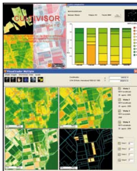
Figura 2. Aplicación para el seguimiento del cultivo en parcela mediante imágenes de satélite.

Otro aspecto importantísimo es saber el estado hídrico del cultivo. En esta línea también han trabajado los mencionados grupos de investigación viendo las posibilidades de utilización la teledetección para la estimación de la evapotranspiración y la determinación de coeficientes de cultivo, aspectos necesarios, por ejemplo, en la realización de balances hídricos y programaciones de riego, etc. En este caso se ha usado información derivada de imágenes Landsat para estimar evapotranspiración a escala regional: a) mediante modelos de balance de energía (por ejemplo, SEBAL), basados en la temperatura de la superficie vegetal obtenida de las imágenes Landsat y en datos meteorológicos registrados en zonas representativas del área de estudio (Ramos et al. , 2009); y b) mediante modelos de cálculo de coeficientes de cultivo a partir de índices de vegetación obtenidos de las imágenes Landsat y de datos in situ de humedad del suelo (Campos et al. , 2010, en este número); esta segunda alternativa se ha aplicado en Aragón sobre todo en leñosos.