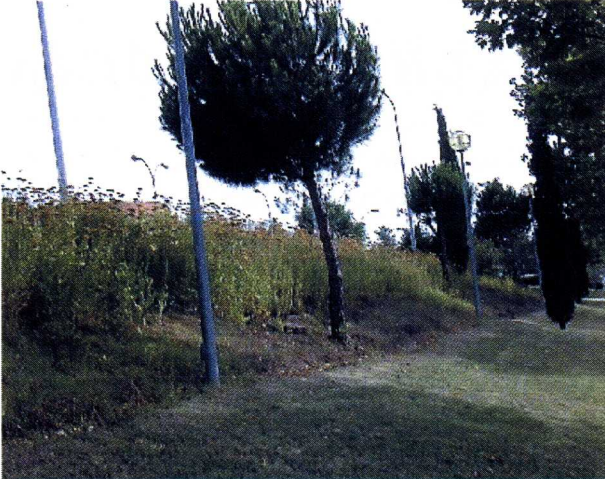
Figura 1: Achillea filipendulina en un jardín público.