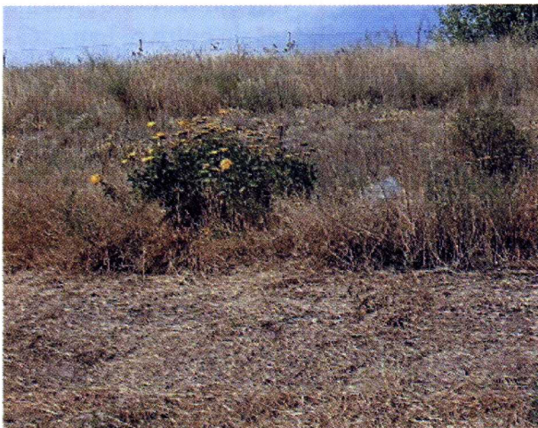
Figura 3: Achillea filipendulina naturalizada fuera de cultivo.

ral, a su origen foráneo con relación al territorio donde aparecen; y de las tres últimas dos se refieren a criterios ecológicos y de comportamiento (no todas las invasoras son alóctonas) y, la última, a criterios fundamentalmente antrópicos y medio ambientales [según la Ley de Protección Vegetal (Plant Protection Act) aprobada por el Congreso de EE.UU. en 2000 se define como mala hierba nociva (noxious weed): "Cualquier planta o producto vegetal que pueda directa o indirectamente perjudicar o dañar a los cultivos (incluyendo invernaderos o productos vegetales), ganado, aves de corral u otros intereses de la agricultura, riego, navegación, recursos naturales del país, la salud pública o