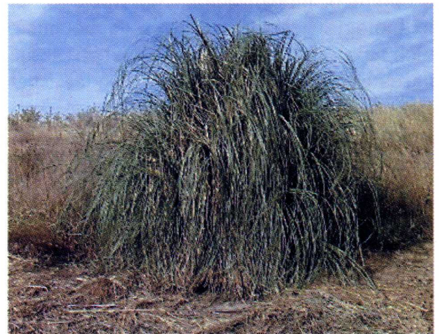
Figura 4: Cortaderia selloana naturalizada fuera de cultivo.