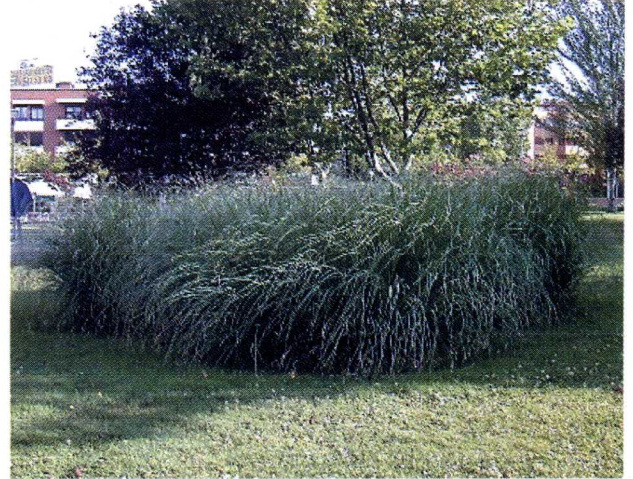
Figura 2: Cortaderia selloana en un jardín público.

De entre las especies que constituyen la flora antropófila, que incluye tanto a las especies de cultivo como a las que se comportan como malas hierbas ( sensu lato ) y a las especies ruderales, serán tanto más agresivas en sus nuevas localidades cuanto mayor sea su capacidad para adaptarse, propagarse, y competir, lo cual se puede resumir en su capacidad invasora.