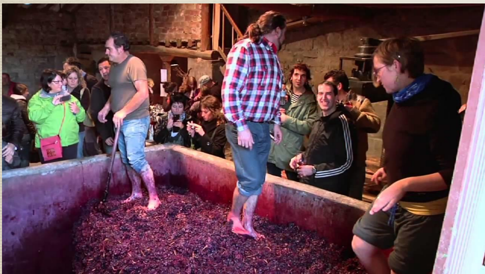
Pisando uva para hacer vino natural. Bodega CERRO