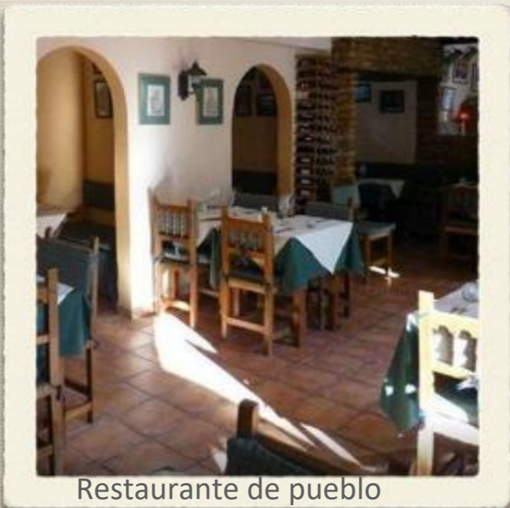
Restaurante de pueblo