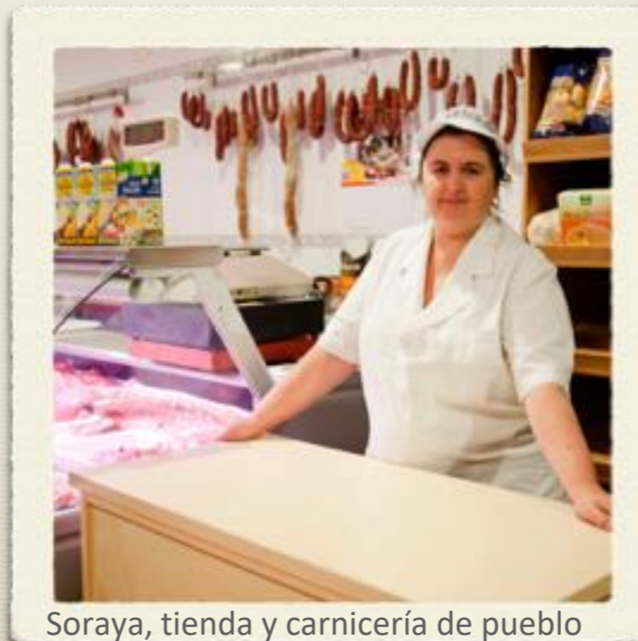
Soraya, tienda y carnicería de pueblo