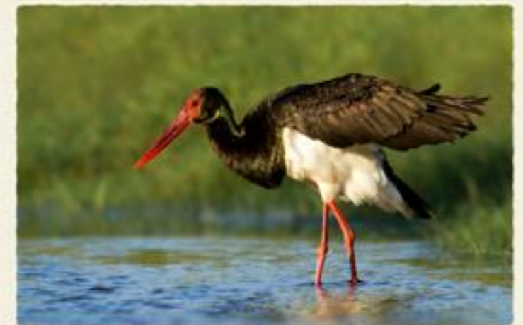
Cigüeña negra (Ciconia nigra)