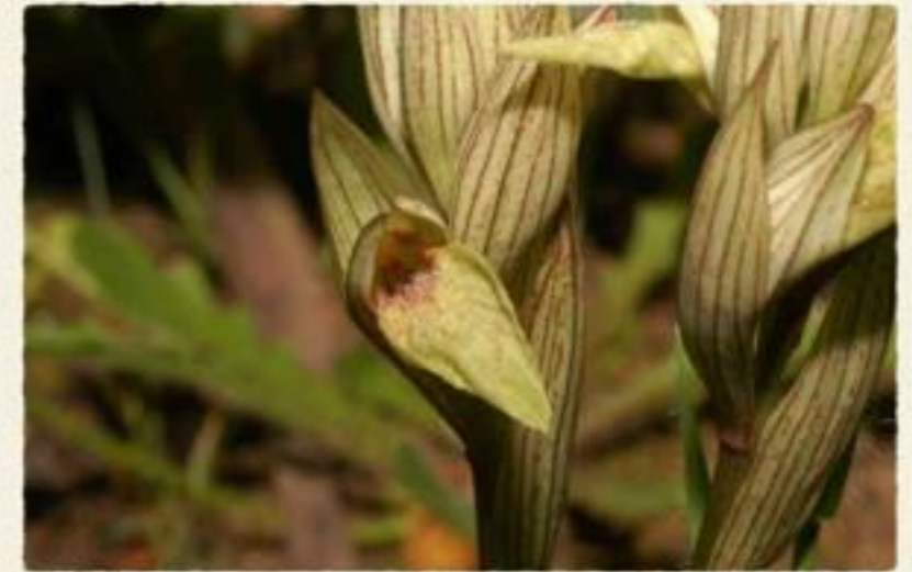
ORCHIDACEAE (Serapias perez-chiscanoi C. Acedo)