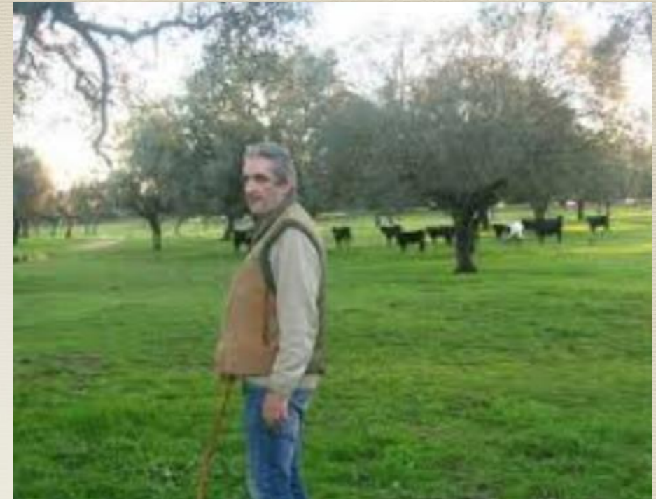
Ganadería vacuno ecológico Casa Blanca.