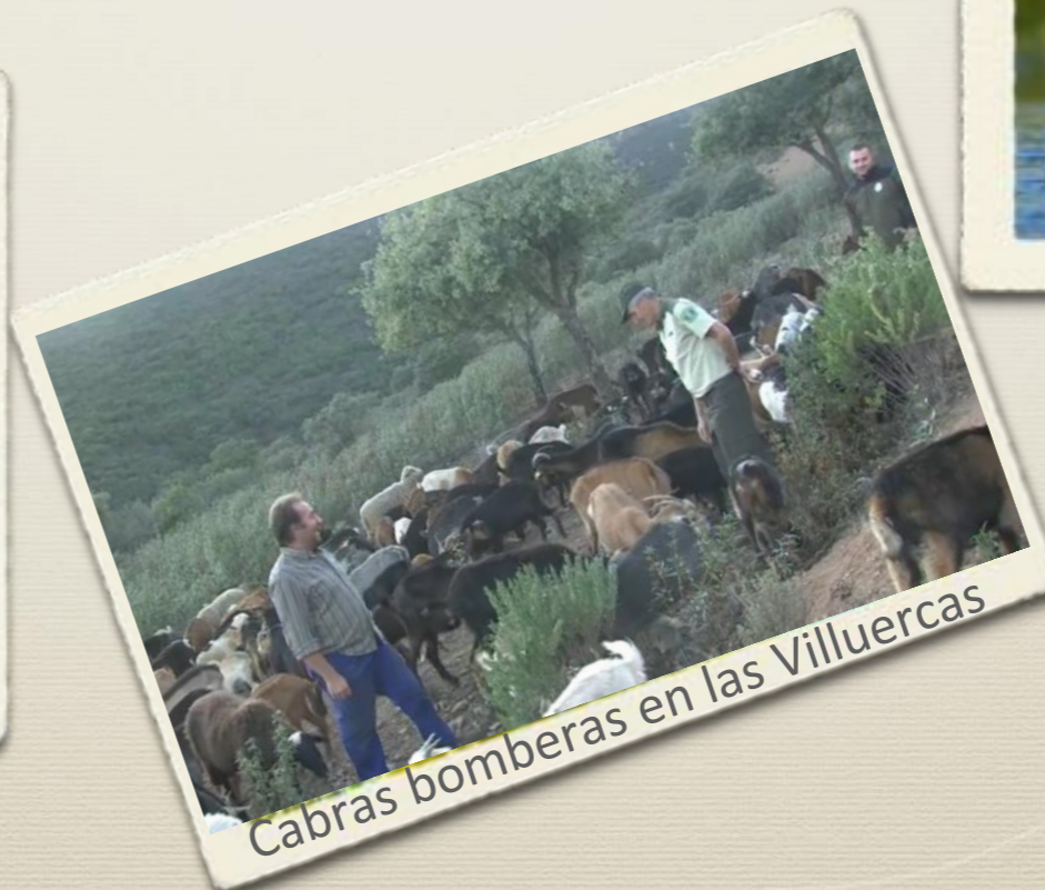
Cabras bomberas en las Villuercas