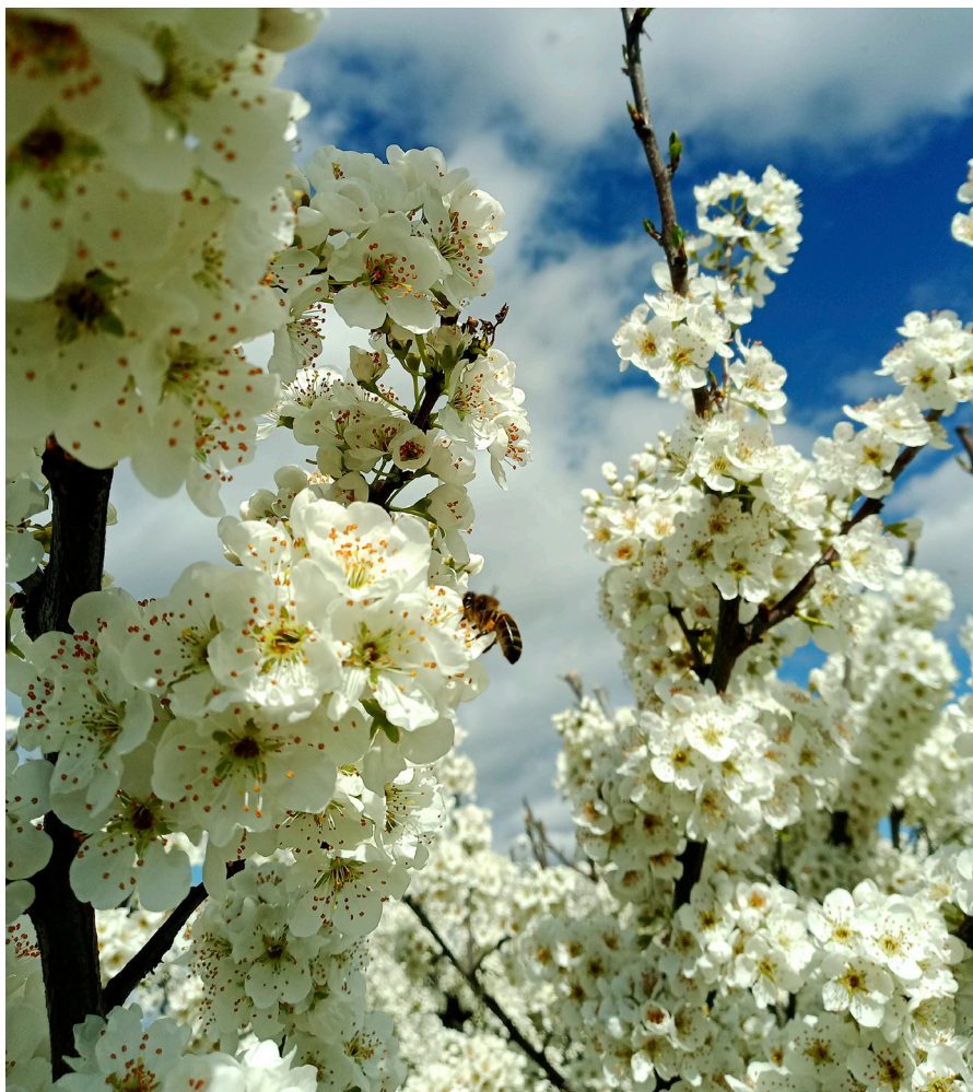
FOTO 1 Flores de ciruelo japonés.