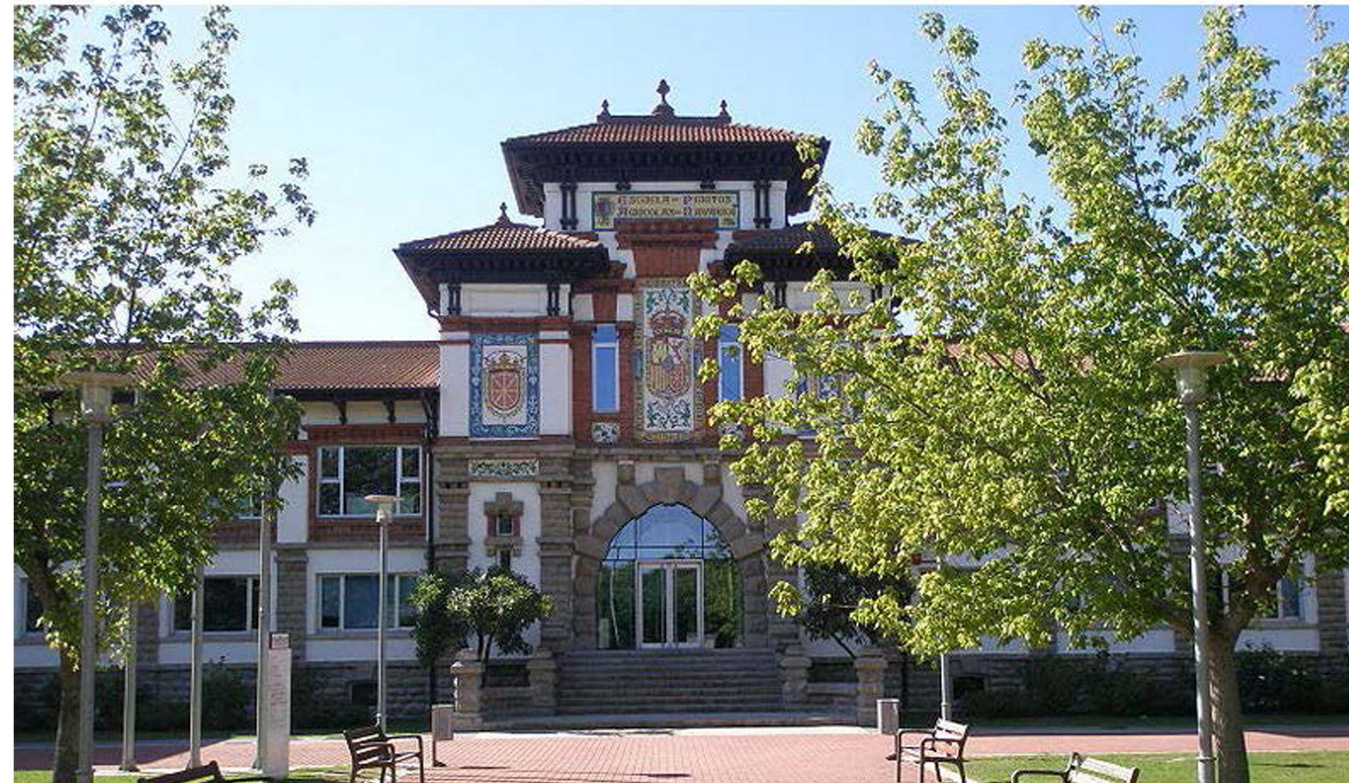
La Escuela, ocupa desde su creación en 1914, el edificio construido para albergar el Congreso Nacional de Viticultura en el año 1912, conmemorativo del VII Centenario de la batalla de las Navas de Tolosa