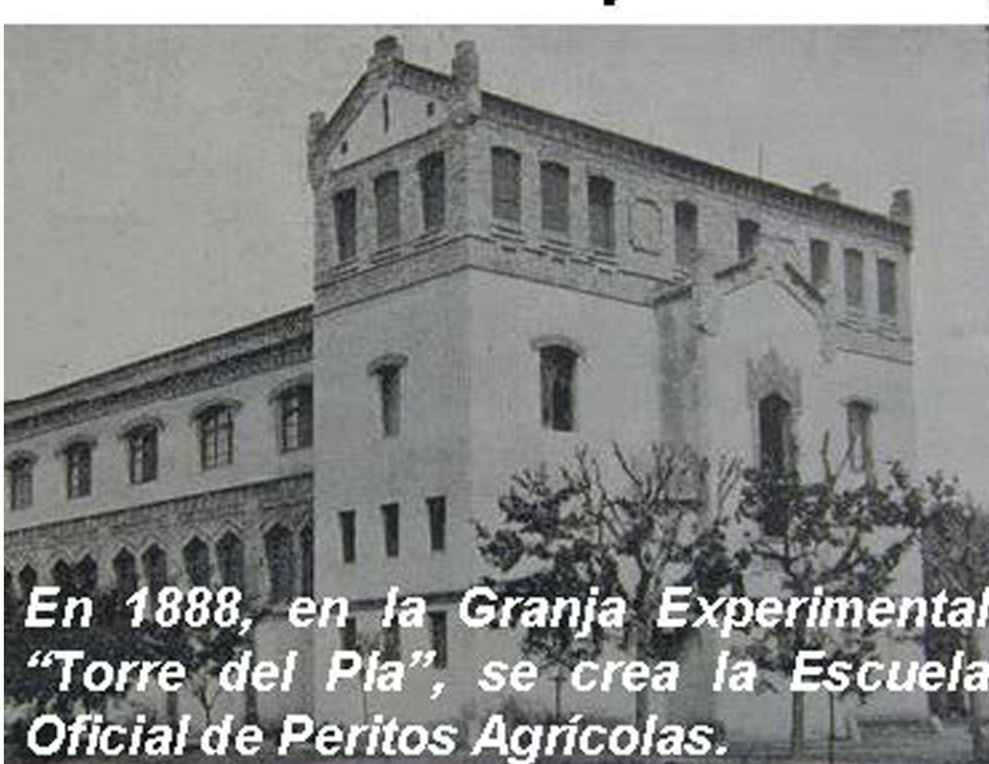
En 1888, en la Granja Experimental "Torre del Pla", se crea la Escuela Oficial de Peritos Agrícolas.