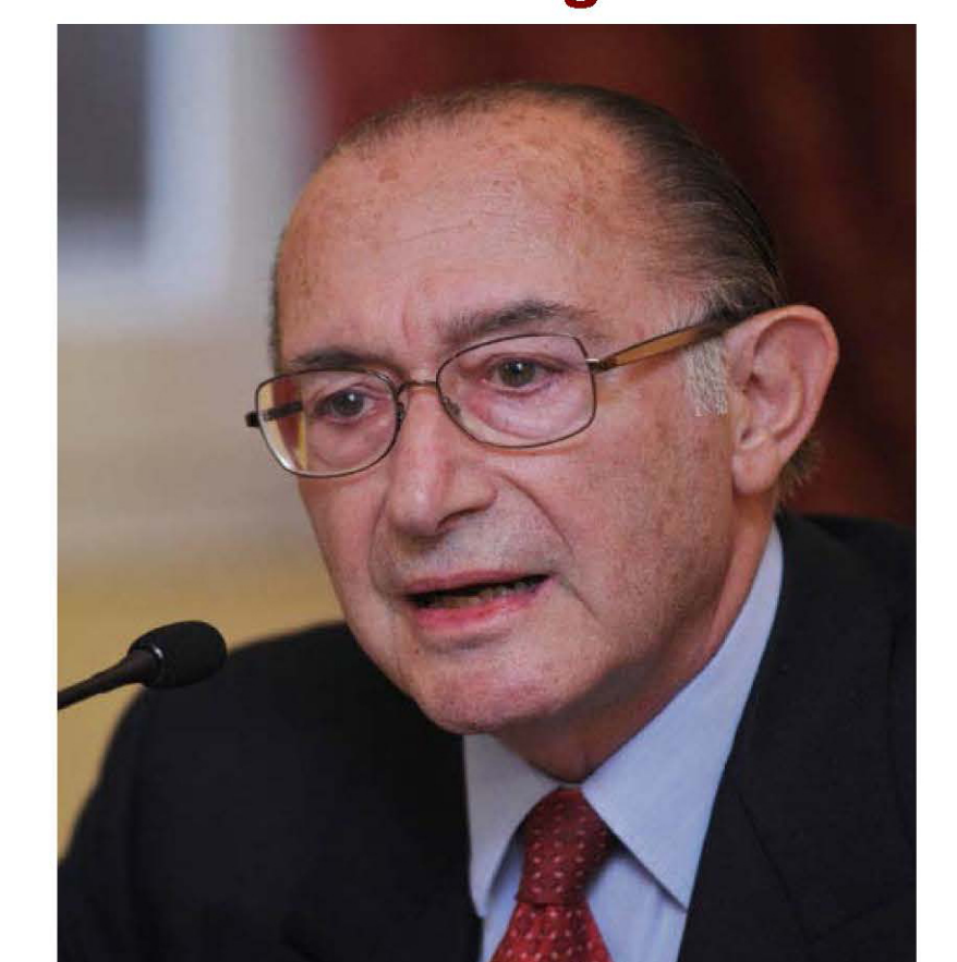
Jaime Lamo de Espinosa (1941).

Dr. Ing. Agrónomo. Catedrático de Genética. De las Academias de Ciencias y de Ingeniería. Obtentor en Aula-Dei (Zaragoza) de la cebada "Albacete", legándose a sembrar más de 1 millón de has.