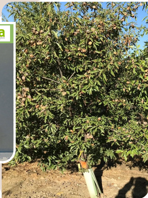
FELAMA (CPVO 20231486)