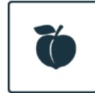
frutales de hueso