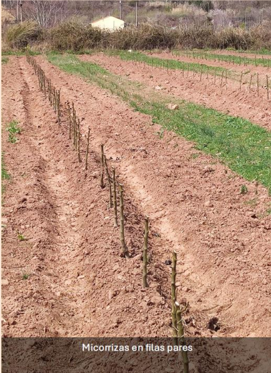
Micorizas en filas pares