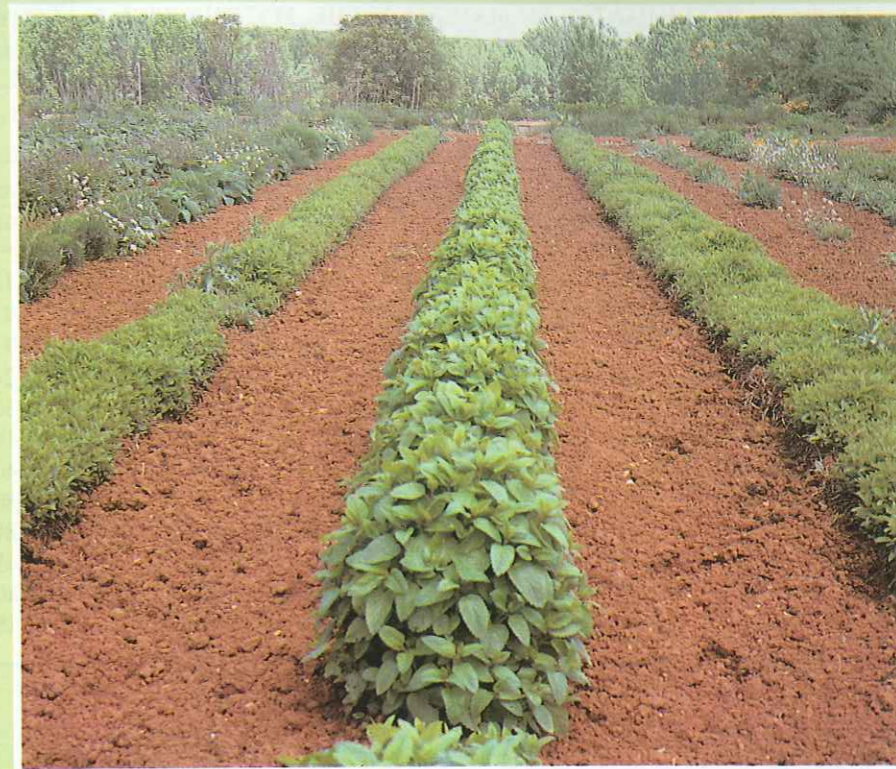
E.C.A. Barrio de San Blas (Teruel). Colección de cepas madre en especies aromáticas y medicinales, línea central «Melissa officinalis» antes de iniciar la floración.

Como resumen, cabe señalar que, dependiendo de todas las variables que pueden tenerse en consideración (tipo de terreno, mecanización, material vegetal), la plantación oscilará entre las 100 000 y las 150 000 ptas/ha.