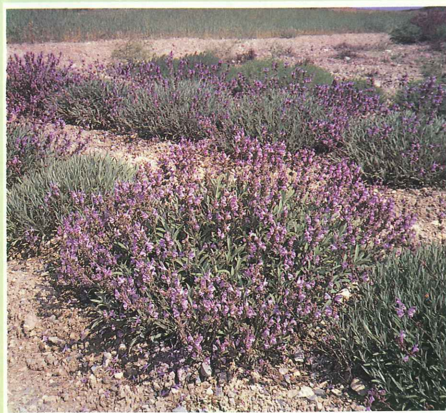
Calamocha (Teruel). Salvia de Aragón al 60-70 % de floración.

Con precios actuales (1990), y teniendo en cuenta los rendimientos de las diferentes operaciones señaladas anteriormente, la inversión prevista para acometer la instalación de una hectárea, se situaría en torno a las siguientes cantidades: