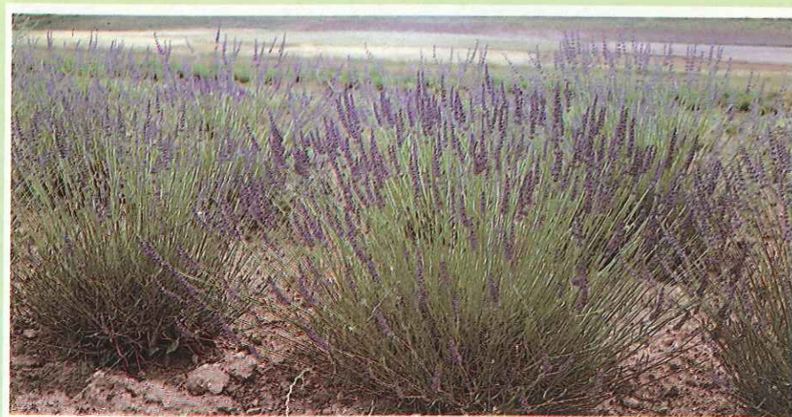
Alacón (Teruel). Ejemplares de Lavandín Abrial en plena floración, instantes previos a su recolección.