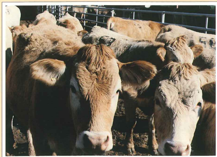
Explotación ganadera. Rebaño de vacas de la raza pirenaica.

Los estados miembros podrán fijar las exigencias medioambientales que consideren apropiadas en relación con «la situación específica de las tierras agrícolas utilizadas y la producción en cuestión». Tendrán la posibilidad de suprimir las ayudas en caso de que no se respeten esas condiciones.