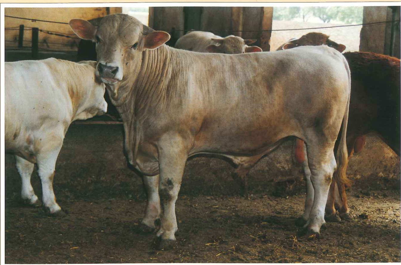
Parda Alpina. Esta raza ganadera tiene una amplia representación en el Pirineo aragonés.