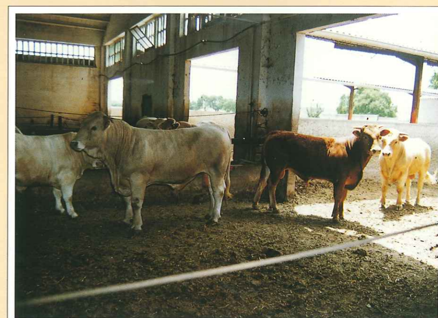
Establo. La cabaña de vacuno de carne en Aragón ronda los 50.000 ejemplares.

Asimismo, existe una excelente infraestructura de comercialización (mataderos y fábricas de pienso) y una idónea ubicación y mayor cercanía al resto de países de la UE. ■