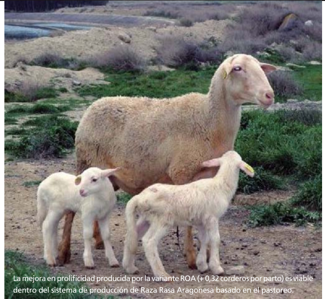
La mejora en prolificidad producida por la variante ROA (+0,32 corderos por parto) es viable dentro del sistema de producción de Raza Rasa Aragonesa basado en el pastoreo.

En este artículo veremos que la acción de determinados genes mayores tiene un gran efecto sobre la tasa de ovulación.