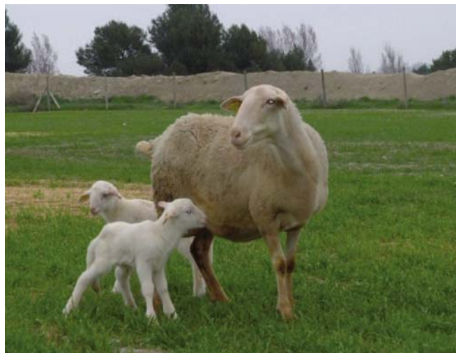
Oveja con gen ROA.

Llegamos a la conclusión de que había indicios de la presencia de un gen de gran efecto que influye en la prolificidad en algunos animales. Mediante la técnica de genes candidatos se descubrió que el