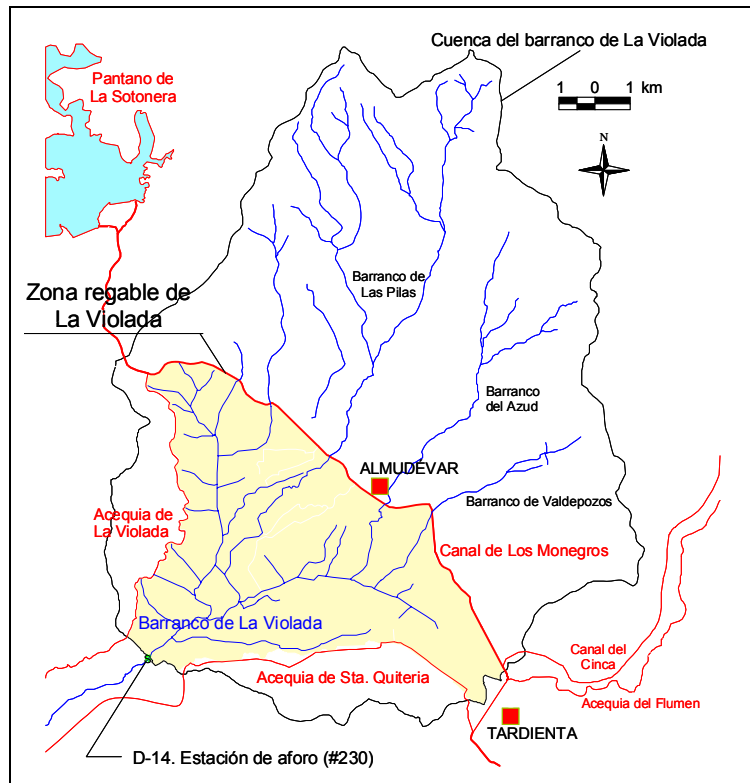
Figura 1. Cuenca del B CO de La Violada y zona regable de La Violada.