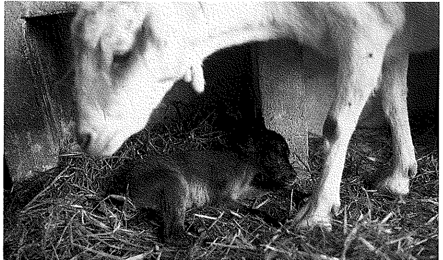
Primer cabrito de transferencia de embrión.

los ovocitos. En estos momentos disponemos de técnicas que permiten la obtención de embriones transferibles de cabra montés. Una vez obtenidos los embriones de cabra montés, se transfirieron a cabras doméstica con la finalidad de comprobar si las gestaciones interespecíficas entre