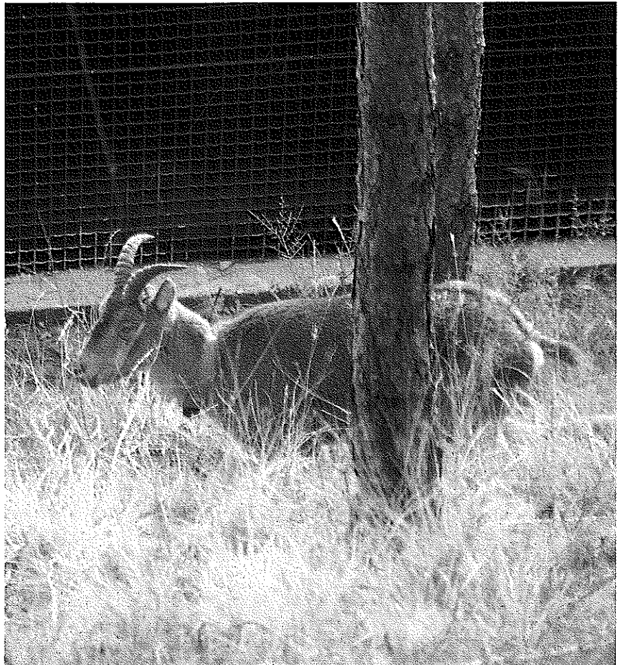
Bucardo en el Parque Nacional de Ordesa y Monte Perdido.

La subespecie lusitanica se extinguió en 1890 y hoy, 100 años des-