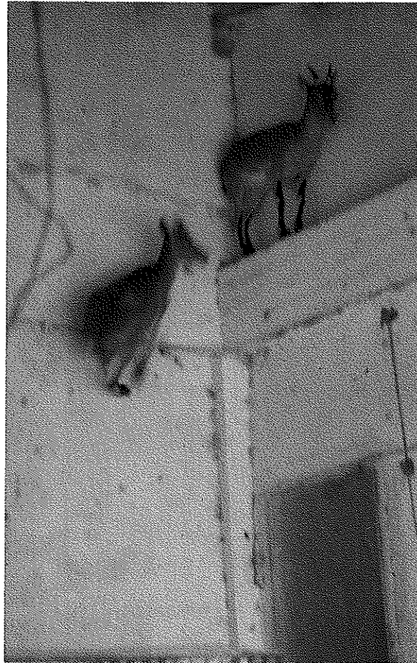
Actualmente los diseños de los cercados de cautividad tienen en cuenta la extraordinaria habilidad de estos animales para subir por paredes totalmente lisas.

En 1989 el antiguo ICONA potenció las medidas de conservación del bucardo mediante la financiación de