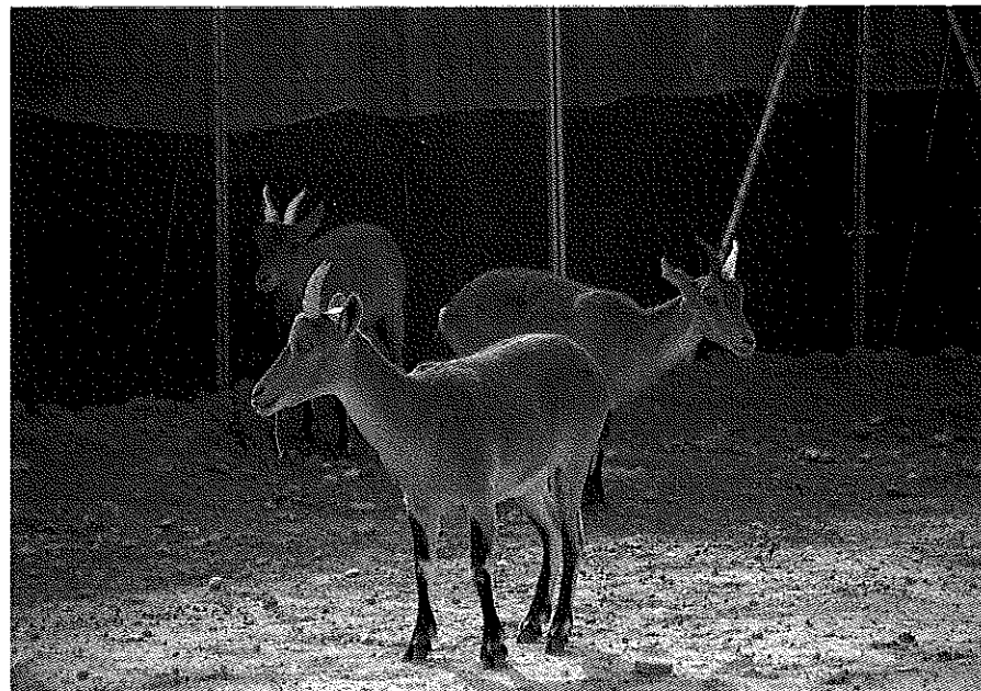
Capras pyrenaicas en un recinto de cautividad..

montés en hábitats similares al del bucardo. Sin embargo, es preciso realizar un estudio de supervivencia de cabras monteses en zonas alpinas para confirmar que el bucardo habita zonas donde otras cabras monteses no son capaces de sobrevivir. Los intentos de reintroducción de cabras monteses procedentes del Macizo de Gredos y de la Sierra de Cazorla, reallizados por el Servicio Nacional de