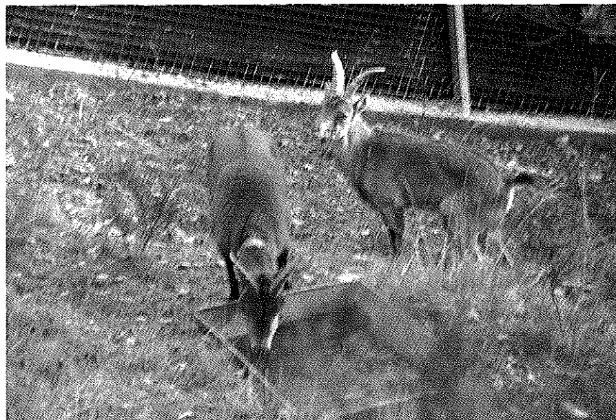
Bucardos sacian su sed en uno de los centros de cuatividad.

En el siglo XIX el bucardo constituía uno de los trofeos más escasos de Europa. Conocidos cazadores, principalmente de nacionalidad inglesa y francesa, acudían a los últimos reductos de la Maladeta, Ordesa y Monte Perdido para abatir alguno de los rarísimos ejemplares supervivientes. Estos se sumaban a la presión venatoria de la población local