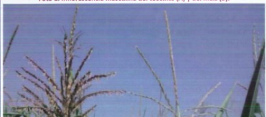
Foto 1. Inflorescencia masculina del teosinte (A) y del maíz (B).

Pardo, G.; Cirujeda, A.; Betrán, E.; Fernández Labat, S.; Fuertes, S.; Rodríguez, E.; y otros, "Teosinte, una nueva mala hierba que amenaza al maíz", Tierras de Castilla y León: Agricultura , n.º 223, 2014, pp. 52-56. http://hdl.handle.net/10532/2771