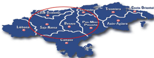
Figura 1. Localización por comarcas de los ganaderos encuestados.

Para el estudio Delphi se han seleccionado un total de 22 expertos, compuestos por 15 ganaderos con vacuno de raza Tudanca y 7 representantes de los restantes sectores de la cadena (2 industria, 1 distribución, 2 carnicería, 2 restauración). Para la selección de los 15 ganaderos se contó con la ayuda de la Asociación Nacional de Criadores de Ganado Vacuno de Raza Tudanca, teniendo en cuenta el tamaño de la explotación (13% más de 100 UGM, 40% entre 50 y 100, 47% menos de 50 UGM) y su localización por comarcas (8 Saja-Nansa, 2 Costa Occidental, 2 del Besaya, 2 de Campoo, 1 Pas-Miera Pisueña) (Figura 1).