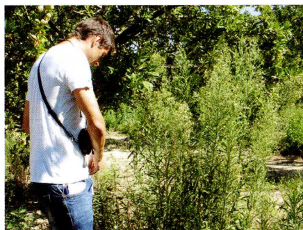
Conyza sumatrensis puede alcanzar una altura importante en buenas condiciones de humedad y fertilidad, como suele ser en la cercanía de los goteros de riego.

donde c es el límite inferior de la curva, d es el límite superior, e es la EC_{50} o lo que es lo mismo, la concentración efectiva que produce una respuesta a la mitad del valor del parámetro estudiado. En los estudios de resistencia esta EC_{50} se suele llamar LD_{50} para los datos de supervivencia o GR_{50} para los de biomasa y sería la dosis de herbicida que reduce un 50% la supervivencia o la biomasa de cada población. El parámetro b es la pendiente de la curva en su punto de inflexión. El ajuste ha sido realizado con el programa de software libre R, Versión 2.14.2 (R Development Core Team, 2014). Finalmente se calculó el factor de resistencia (FR) para cada