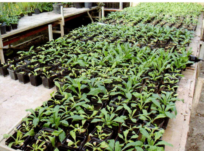
Aspecto general del ensayo 15 días después del tratamiento. Se observan plantas con síntomas de fitotoxicidad por glifosato en plantas sensibles.

Para poder afirmar que se trata de poblaciones de Conyza resistentes a glifosato falta comprobar si la respuesta diferencial entre poblaciones R y S se mantiene en la