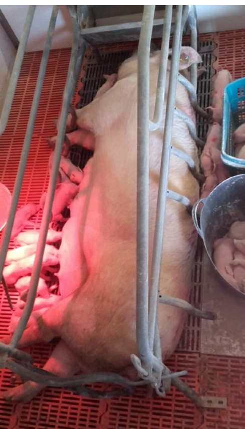
Durante la lactación, el consumo de pienso voluntario por parte de las cerdas no cubre sus necesidades de energía y nutrientes.

de Lys digestible ileal estandarizada/día para el crecimiento de la glándula mamaria (Silva, 2016). Con respecto al resto de aminoácidos esenciales, los requerimientos varían en función del ciclo productivo. Las cerdas primíparas, que presentan mayores pérdidas de proteína corporal, requieren mayores niveles de treonina (Thr) en relación a la Lys, mientras que las múltiparas requieren un mayor nivel de valina (Val) en relación a la Lys.