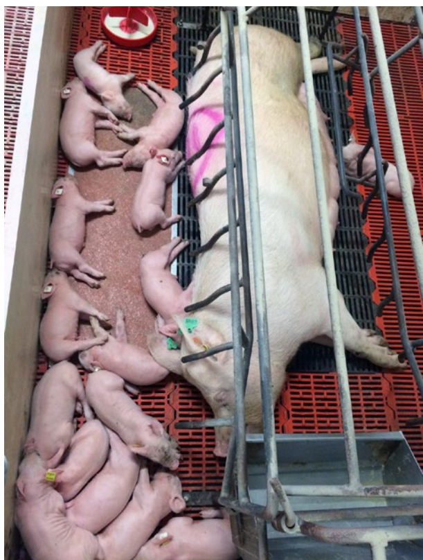
La selección genética en porcino ha derivado en la obtención de cerdas más prolíficas, más eficientes alimentariamente y con mayor porcentaje de magro, velocidad de crecimiento y producción lechera.

En cuanto a las necesidades en aminoácidos, diversos estudios han demostrado una mayor producción de leche y una menor pérdida de peso corporal cuando las cerdas se alimentan con niveles de Lys de 0,75 a 0,90 % (45 a 55 g/día) (NRC, 1998). Así, Strathe et al. (2015) proponen niveles de Lys de 45,5 a 59,5 g/día, y los requerimientos son más elevados en la tercera semana de lactación cuando se produce el pico de lactación. Por otro lado, FEDNA (2013) sugiere niveles de Lys total de 1,03 %. Además es importante que los programas de alimentación tengan en cuenta que las cerdas necesitan 6,2 g