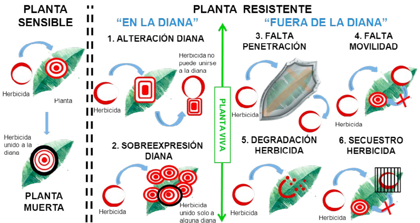
Figura 2: Una planta se hace resistente a un herbicida cuando altera el sitio de acción (diana) y el herbicida ya no le afecta (1) o cuando multiplica la diana por lo que el herbicida sólo le afecta parcialmente (2). Otros modos son: alterar la cutícula de la hoja y ésta se impermeabiliza al herbicida (3), impedir que éste se mueva dentro de la planta (4), degradarlo en componentes inocuos (5) o secuestrarlo en vacuolas para que no llegue a su destino (6).