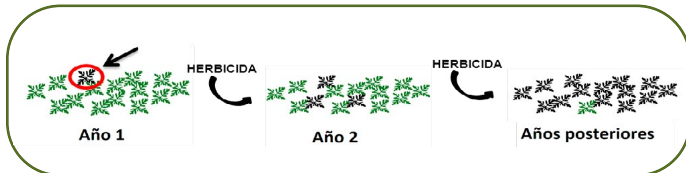
Figura 3: Esquema de como el número de malas hierbas resistentes (planta en negro) va aumentando progresivamente en la parcela tras aplicar el mismo modo de acción de herbicida, estamos seleccionando la población resistente con nuestro manejo (Royuela M. 2014).

Más información ( https://semh.net/grupos-de-trabajo/cprh/ ).