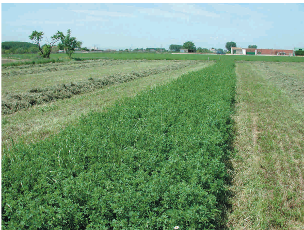
Franja sin cortar en un campo con riego por inundación