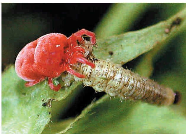
Ácaro depredador ( Allothrombium sp.) alimentándose de una larva de Hypera postica (gusano verde)

Cuando un cultivo de alfalfa se corta de la forma tradicional, es decir, en bloque, los insectos se dispersan a otros hábitats y tardan un cierto tiempo en volver. Esto da lugar a una falta de sincronización con las plagas que disminuye la eficacia de los auxiliares para controlarlas.