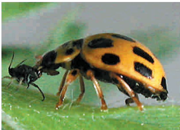
Adulto de Propylaea quatuordecimpunctata alimentándose de un ejemplar de Aphis craccivora (pulgón negro)

Dejar franjas de alfalfa sin cortar proporciona refugio a los auxiliares tras el corte y facilita su establecimiento y conservación en nuestros cultivos (control biológico de conservación) lo cual, a su vez, favorece el control biológico natural de las plagas.