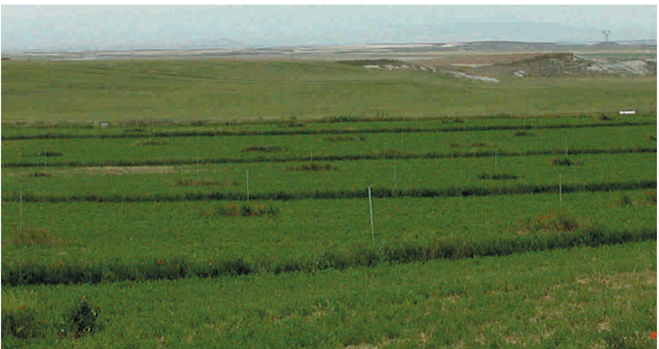
Franjas de alfalfa sin cortar en una parcela con riego por aspersión

Es importante evitar que la segadora pise las franjas.