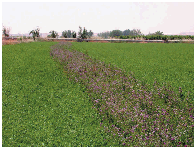
Aspecto de una franja poco antes de realizarse el tercer corte