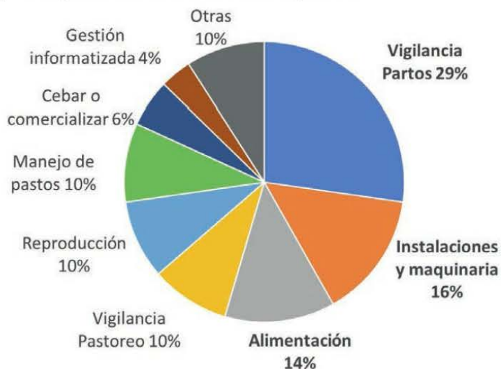
Figura 1. Principales áreas de innovación inmediata en las explotaciones.

Porcentaje de ganaderos encuestados que han implementado o van a implementar una innovación de este tipo.