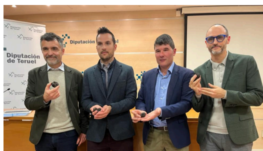
Diario de Teruel La trufa de Teruel cautivarà en Nueva York a los cocineros del Culinary Institute of América