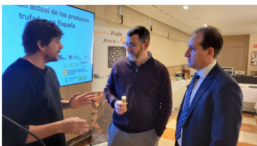
Diario de Huesca El Mercado de la Trufa Negra reclama respaldo legislativo para proteger a consumidores y truficultores