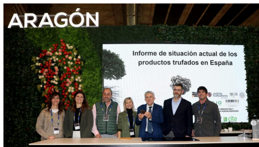
Diario del Alto Aragón La truficultura y las legumbres de montaña se promocionan en Fitur