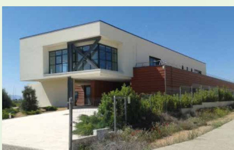
Edificio Platea (Teruel)