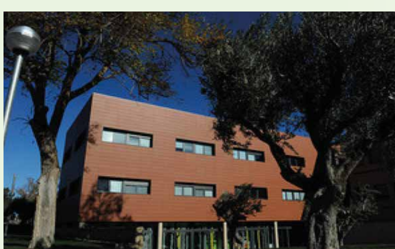
Instalaciones centrales (oficinas, laboratorios...) Montañana (Zaragoza)