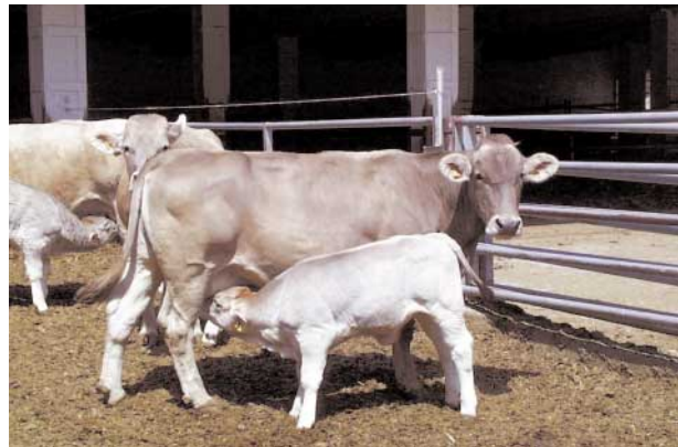
La prolongación de la lactación en establo en los rebaños de cría supone un sobrecoste que no se compensa por el mayor precio del ternero al destete.

En términos económicos ( Tabla 3 ), la raza no afectó al margen económico logrado por los rebaños de cría, al ser reducida la diferencia entre los ingresos percibidos por los terneros destetados de ambas razas. Sin embargo, el mayor ingreso obtenido de las canales Pi, por su mayor rendimiento y conformación, con un coste similar en lactación y cebo, hizo que los beneficios logrados con esta raza fueran superiores tanto para los cebaderos como para las explotaciones de ciclo completo.