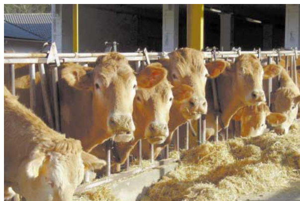
La alimentación de las vacas durante el periodo de estabulación supone la mayor parte de los costes de producción de los terneros destetados.

Las vacas de raza Pi presentaron mayor peso y condición corporal en el momento del parto (573 vs. 628 kg en PM y Pi, respectivamente, y 2,54 vs. 2,61 puntos de CC), diferencia que se mantuvo durante todo el ensayo. No se observaron diferencias entre razas en las ganancias de peso hasta los 150 dpp, aunque la recuperación de peso posterior (150-340 dpp) fue superior en las vacas de raza PM (Tabla 1). Este resultado es contrario al observado por Casasús et al. (2001) al comparar las ganancias de peso en pastoreo en ambas razas, si bien se explica porque la recuperación de peso en pastoreo es superior en los animales que lo inician con un menor estado de reservas, como indicaría en este caso la menor CC de las vacas PM al inicio del pastoreo (2,5 vs. 2,6 puntos a 150 dpp en PM y Pi, respectivamente).