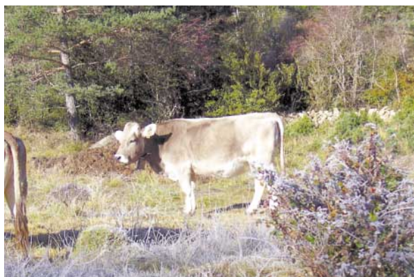
El destete precoz de los terneros permite un eficiente aprovechamiento de los pastos forestales por vacas secas.

Los márgenes obtenidos por las explotaciones de cría y de ciclo completo son similares entre sí, independientemente de la edad de los terneros al destete. De hecho, sólo en la raza Pirenaica es mayor el margen en ciclo completo que en rebaño de cría, mientras que en las explotaciones de raza Parda de Montaña el margen es menor si se ceba al ternero que si se vende al destete, ya que por su menor rendimiento carnicero se obtiene un precio proporcionalmente superior por los terneros destetados que una vez cebados. Con esto, en ausencia de un posible sobreprecio del producto final asociado a una garantía de origen o calidad, cebar los terneros, en sistema intensivo, resultaría de escaso interés para las explotaciones de cría, ya que además implica unas inversiones en instalaciones e inmovilización del capital animal por un tiempo más prolongado, con los riesgos que puede conllevar. Como se desprende de los resultados presentados, los márgenes obtenidos en el cebo son reducidos o incluso negativos , circunstancia que deberá ser tenida en cuenta por las empresas ganaderas, especialmente a partir de la aplicación del desacoplamiento parcial de las ayudas al cebo de terneros.