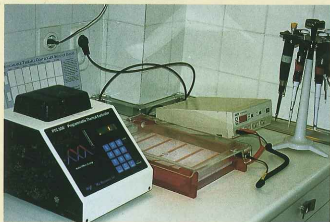
Detección: las nuevas técnicas moleculares realizadas en laboratorio permiten determinar con exactitud la presencia del fitoplasma causante del decaimiento.

La transmisión de la enfermedad se puede realizar mediante injerto y a través de pequeños insectos chupadores conocidos como silas o mietetas del peral del género