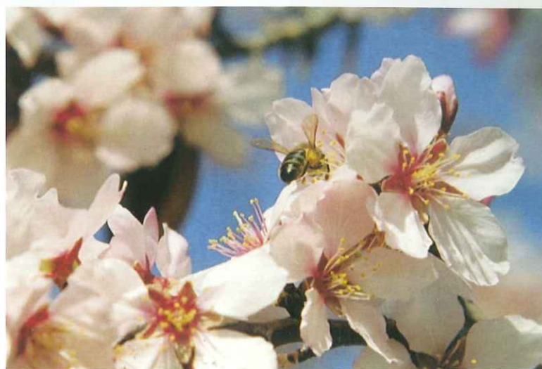
El almendro representa en Aragón el 15% de la superficie global de España.

A UNQUE el almendro y el pistachero son cultivos de una gran antigüedad en España y particularmente en Aragón, sólo el almendro tiene actualmente una verdadera importancia económica, si bien ambos han recibido la atención de nuestros investigadores.