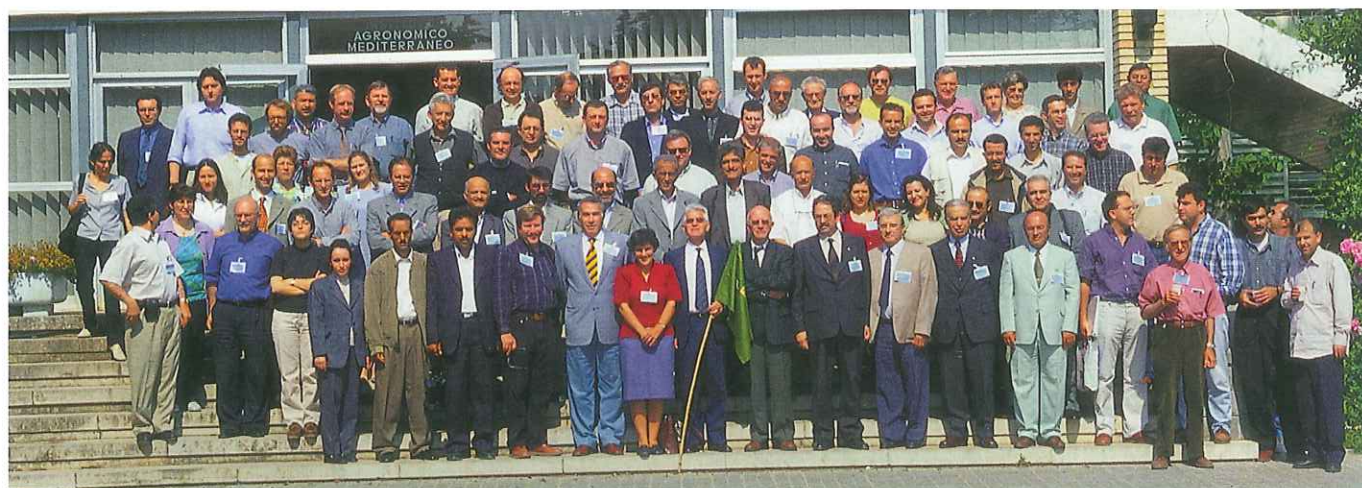
Foto de equipo. Delegados de los cinco continentes debatieron sobre el almendro y el pistachero.

Ante estos retos, los esfuerzos investigadores de Aragón se han centrado en la consecución de un material vegetal para resolver estos problemas. Los avances en la resolución de los problemas de polinización con la obtención de varie-