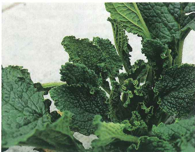
Planta de borraja con abullonado del limbo, rizado y enrollado de las hojas apicales, producido por el CMV.

Aunque no se ha realizado un estudio detallado de la incidencia de la enfermedad en la borraja, se ha observado que el número de plantas afectadas es variable de unos años a otros, al igual que ocurre con el CMV en otros cultivos. Existen diversos factores que influyen en dicho aspecto. Los factores climáticos (temperatura, humedad, etc.) condicionan la existencia de flora arvense y la biología de los pulgones vectores. También influyen factores culturales, como la fecha de siembra, la proximidad de otros cultivos infectados por el virus, la realización de siembras escalonadas en parcelas contiguas, donde las de siembra más temprana pueden servir de foco de virus para las posteriores, la existencia de malas hierbas dentro y fuera de las parcelas, etc.