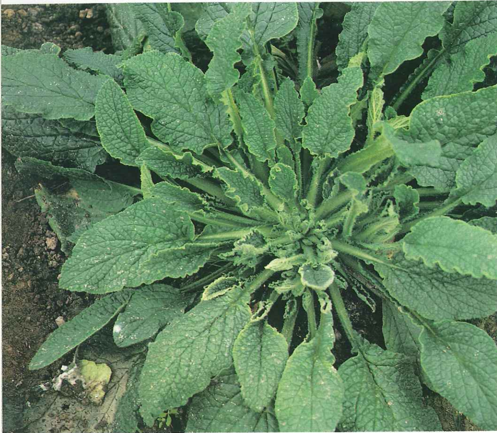
Planta de borraja con parada de crecimiento y deformación foliar en ápice, producido por el CMV.