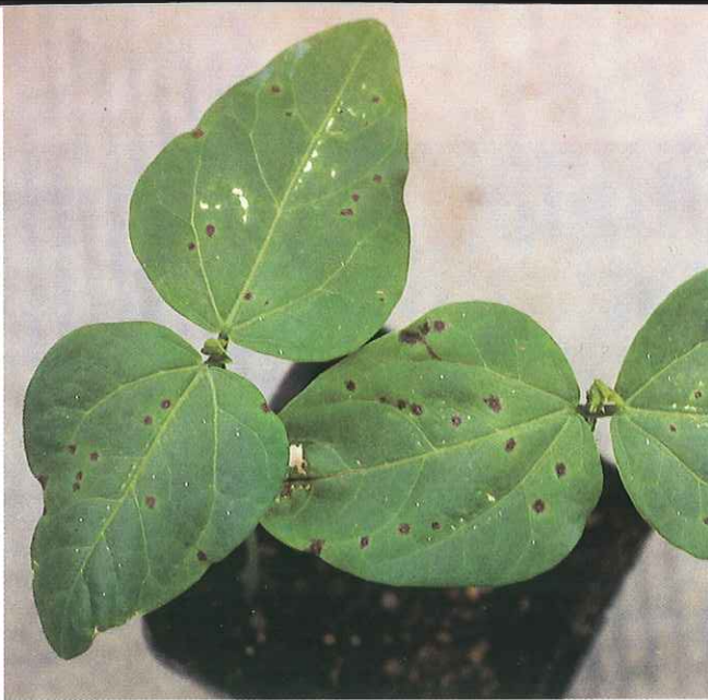
Lesiones necróticas obtenidas sobre hojas primarias de Vigna unguiculata inoculada con el virus obtenido de borraja.