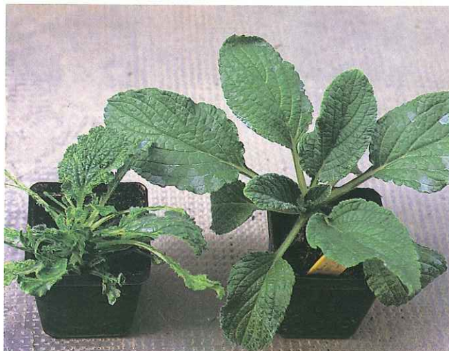
Planta enferma obtenida experimentalmente mediante inoculación mecánica del virus a partir de las muestras del campo (izquierda) en comparación con una planta sana (derecha).

El diagnóstico visual, por sintomatología en campo, es una indicación o ayuda complementaria de las pruebas realizadas en laboratorio e invernadero, pero insuficiente por sí solo.