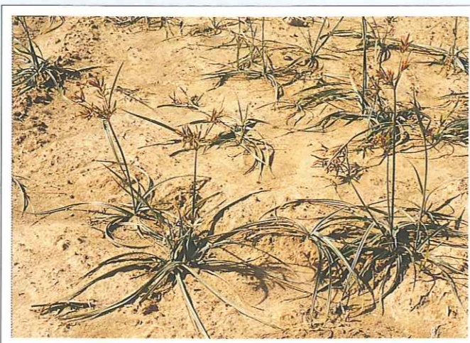
Se ve favorecida en ausencia de competencias con otras especies.

Es una especie termófila, la temperatura mínima es la que determina su distribución geográfica y su desarrollo estacional. La expansión de C. rotundus está aproximadamente limitada por la isoterma de -1° C, media de las