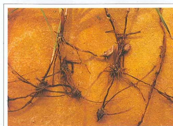
Sus rizomas dan origen a tubérculos, principal fuente de propagación.

3.º Tratamiento con herbicida sistémico (p. ej.: glifosato o sulfosato, a las dosis recomendadas por la etiqueta para esta especie) aprovechando la corriente descendente de la savia, en estado de floración avanzada. Una vez realizado el tratamiento no realizar laboreo alguno hasta pasado al menos un mes.