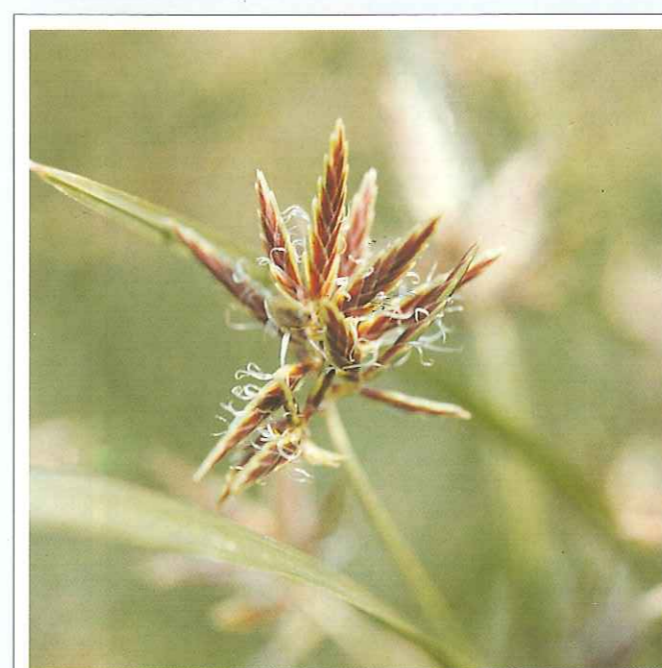
Las espiguillas son agudas, comprimidas y de color pardo-púrpura.

4.º Puesto que las infestaciones se inician generalmente en rodales o pequeños focos se deberán tratar con herbicidas sistémicos, preferiblemente mediante aplicaciones dirigidas sin mojar el cultivo, o bien inmediatamente después de la cosecha cuando las hojas de la juncia aún están verdes y lozanas para que la infestación no se extienda al resto de la parcela. En el caso de maíz se puede realizar el tratamiento dirigido cuando el grano se encuentre en estado de «capa negra» visible (estado vítreo). Los focos de infestación no se deberán labrar para no extender los tubérculos.