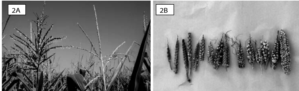
Figura 2A. Penachos de teosinte, izq. y maíz, dcha. 2B. Mazorcas de teosinte con diferente grado de hibridación: menos (izq.) y más hibridadas y parecidas a maíz (dcha.).