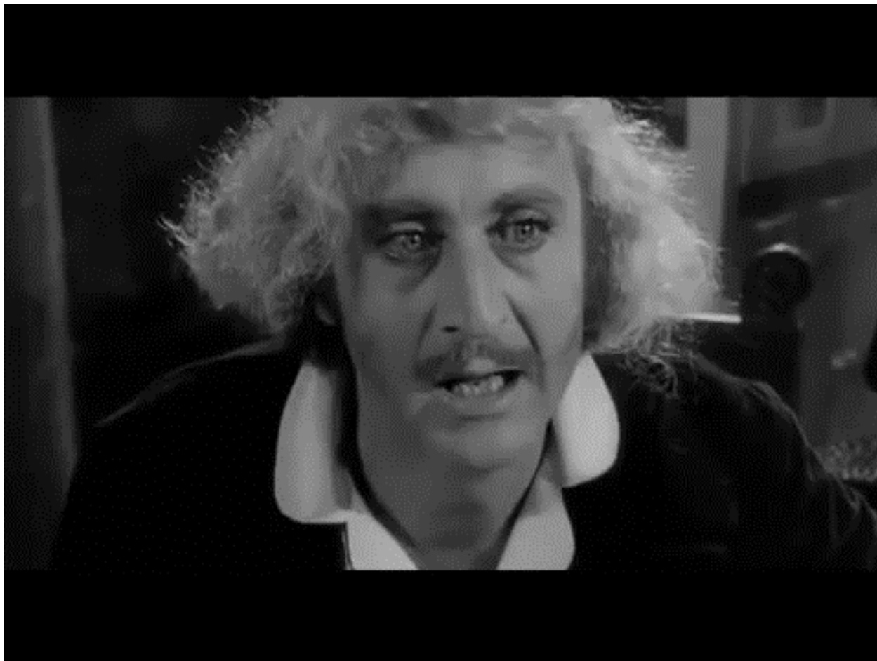
Young Frankenstein , Mel Brooks (1974)