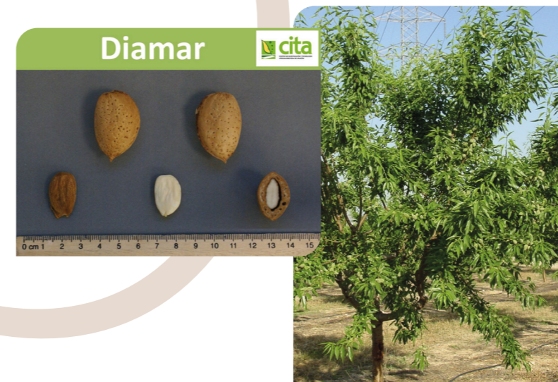
DIAMAR (OEVV-20074764; CPVO-20090306)

Calidad: Su composición presenta valores medios de los diferentes componentes, pero el contenido en ácido oleico es muy alto.