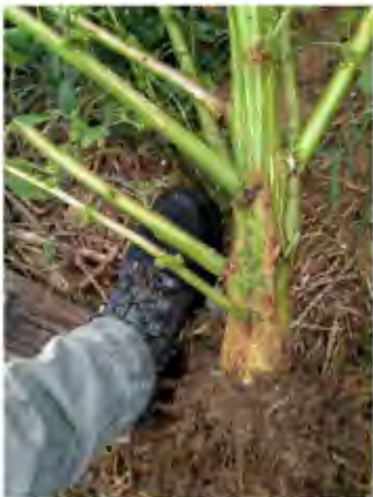
Detalle: tallo de A. palmeri (Ejemplo del vigor que puede alcanzar la planta)

Si se produce la dispersión de A. palmeri por nuestro territorio podría ocasionar un gran impacto económico y ecológico de consecuencias impredecibles.