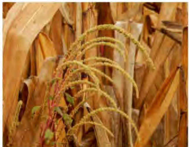
Inflorescencia masculina en cultivo de maíz