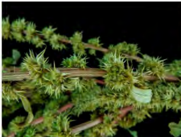
Detalle: brácteas espinosas