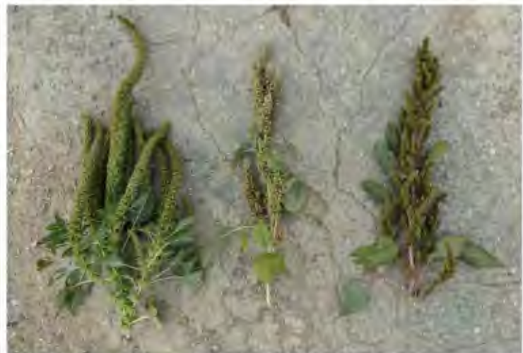
Inflorescencias de A. palmeri (Pie femenino), A. hybridus y A. retroflexus