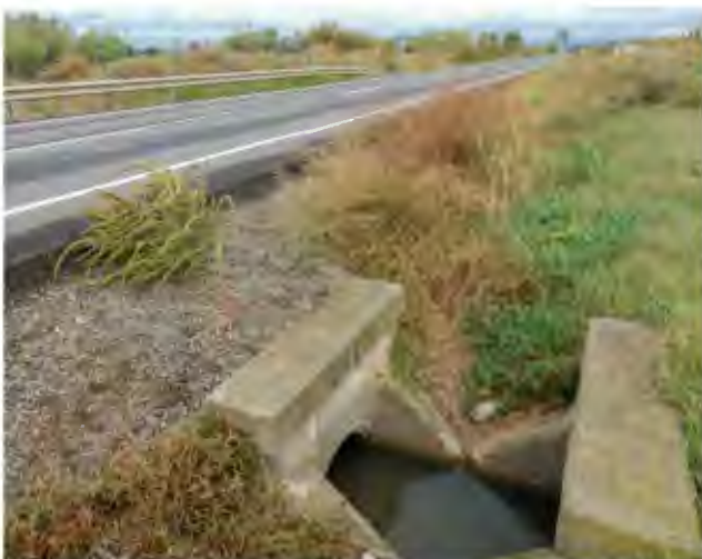
Planta femenina en cuneta. Alto riesgo de propagación por proximidad a acequia