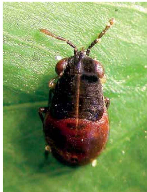
Ninfa de geocórido