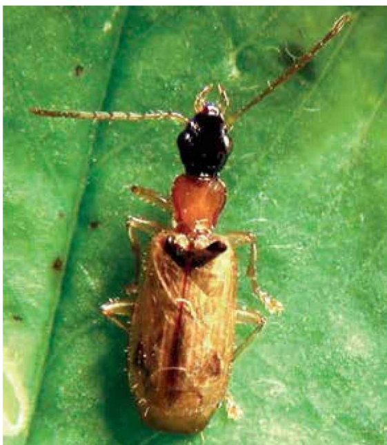
Carábido ( Demetrias atricapillus )