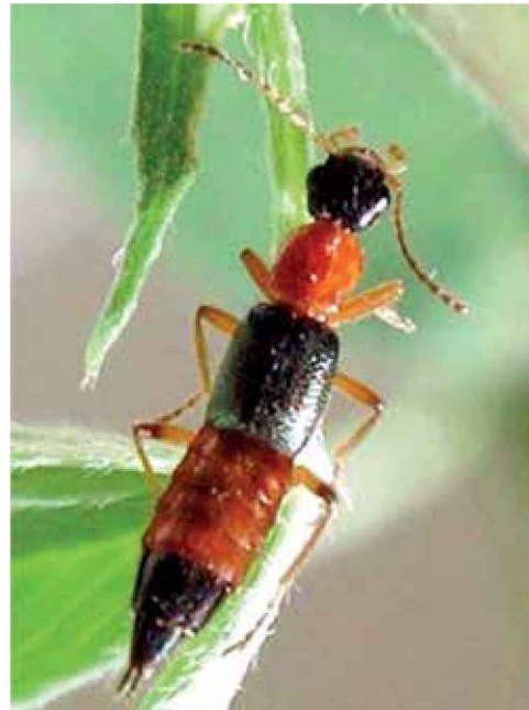
Estafilínido ( Paederus fuscipes )