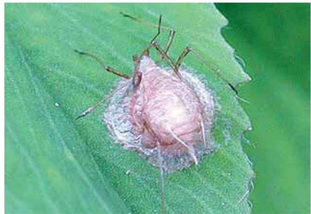
Pulgón momificado, parasitado por un himenóptero del género Praon