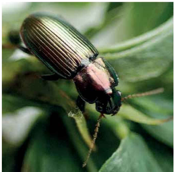
Carábido ( Harpalus sp.)