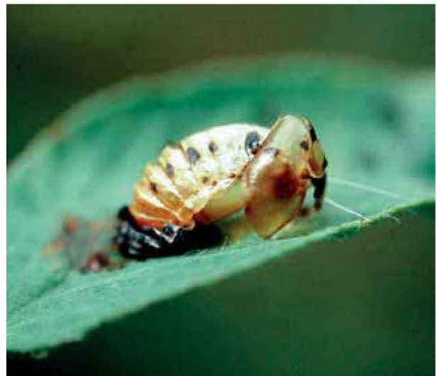
Pupa de coccinélido