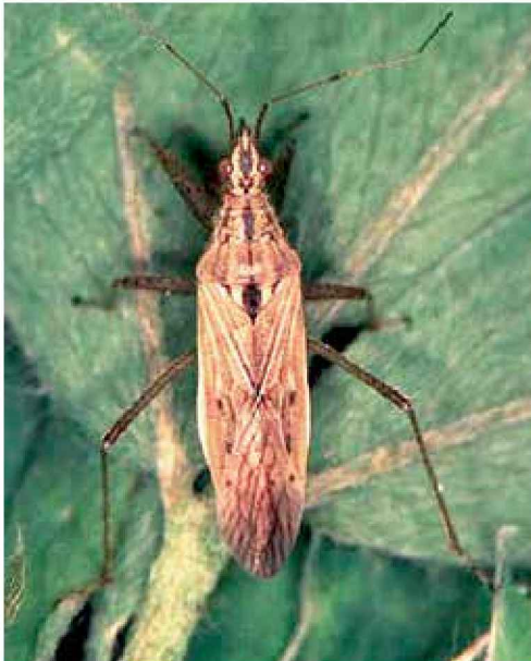
Nábido adulto ( Nabis provencalis )