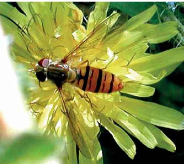
Sírfido adulto ( Episyrphus balteatus )