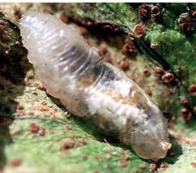
Larva de sírfido