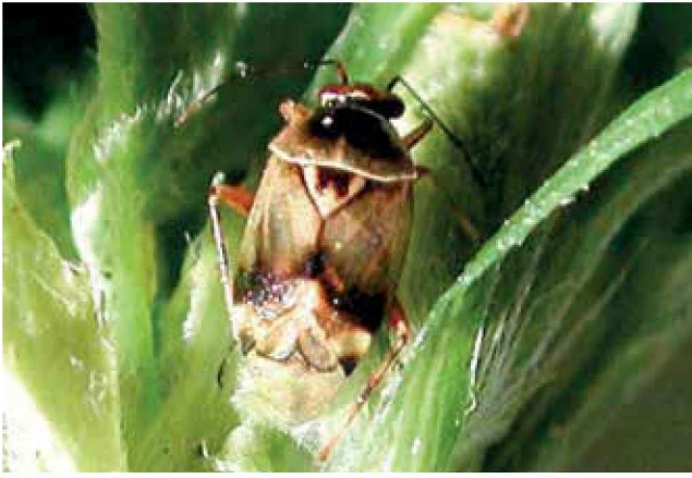
Hemíptero de la familia Miridae ( Deraiocoris sp.)