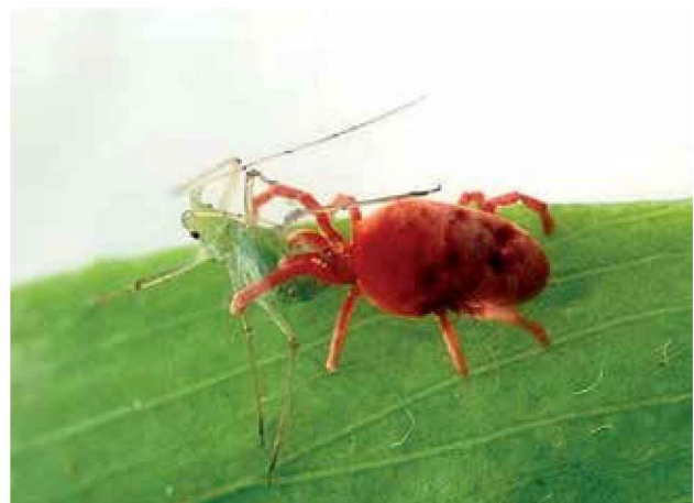
Ácaro depredador ( Allothrombium sp.)