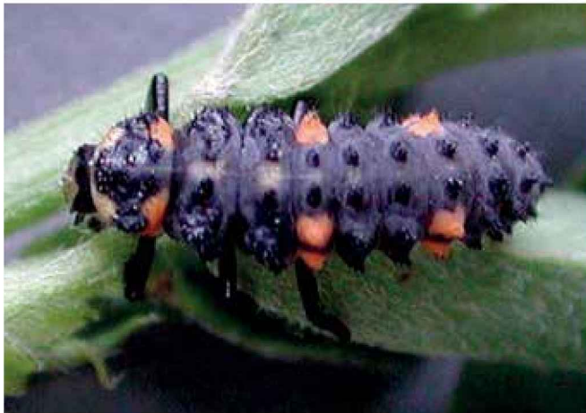
Larva de coccinélido