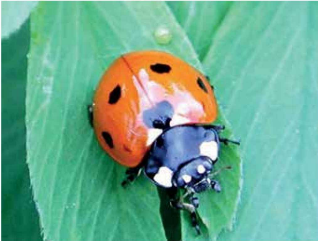
Coccinélido adulto ( Coccinella septempunctata )