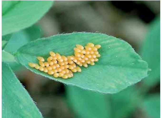
Puesta de coccinélido