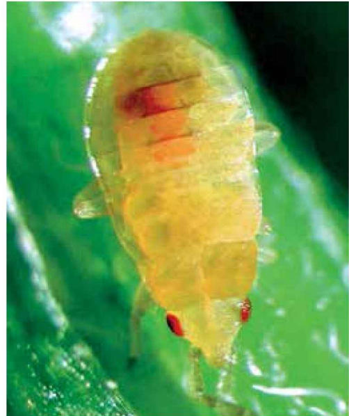
Ninfa de antocórido