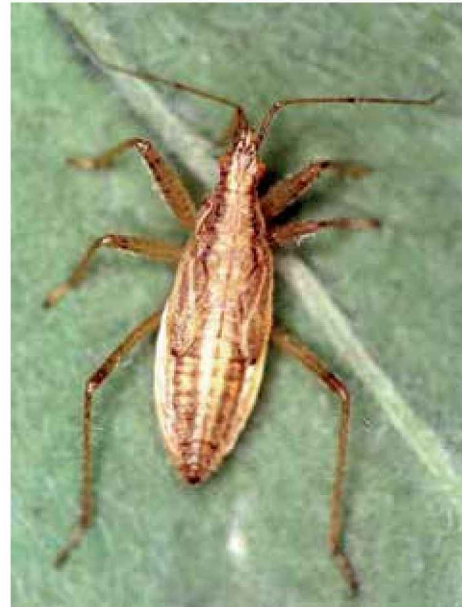
Ninfa de nábido