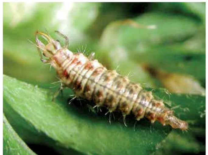
Larva de crisopa