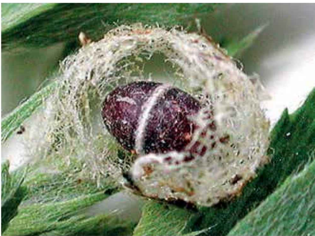
Capullo del gusano verde ( Hypera postica ) con larva parasitada por un himenóptero