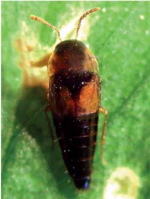
Estafilínido ( Tachyporus sp. )