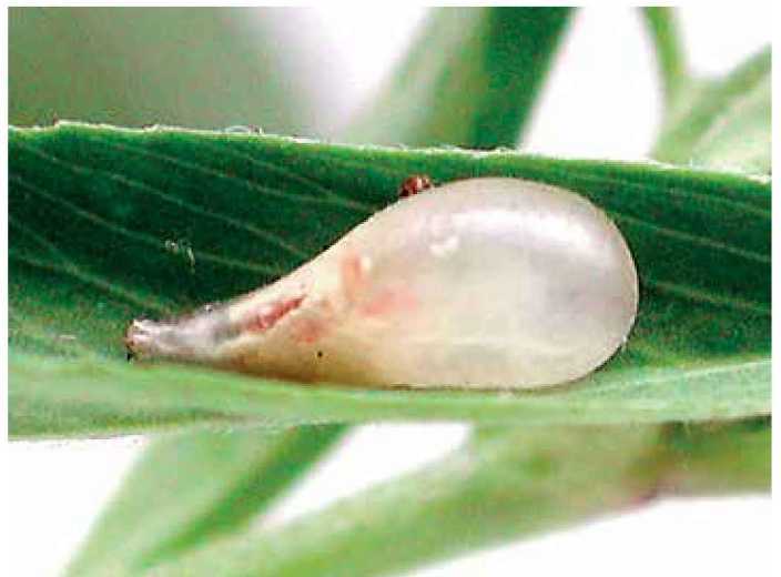
Pupa de sírfido