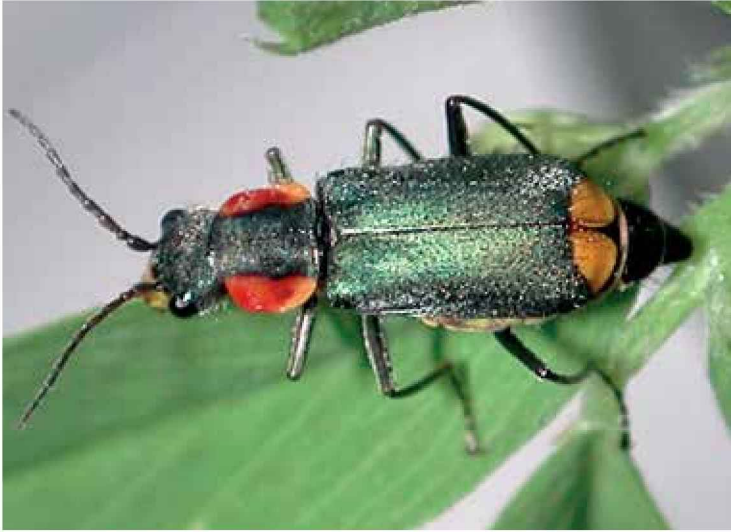
Maláquido (Hembra de Clanoptilus marginellus )