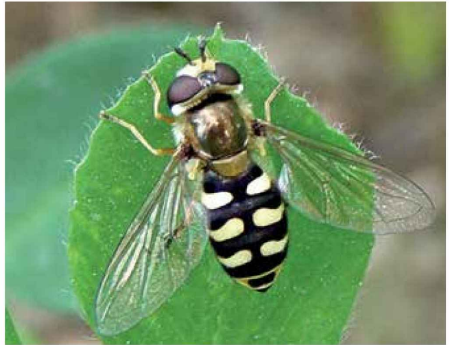
Sírfido adulto ( Eupeodes corollae )