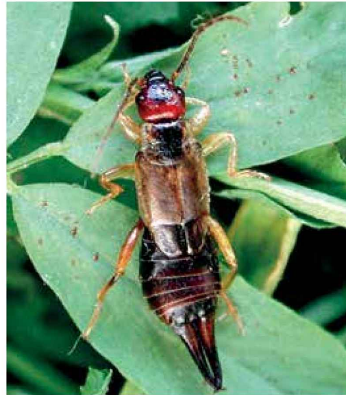
Dermáptero ( Forficula auricularia )