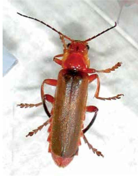
Cantárido ( Cantharis livida )