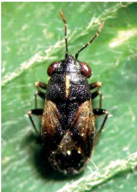
Geocórido adulto ( Geocoris lineola )