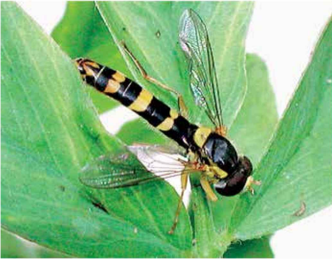
Sírfido adulto ( Sphaerophoria scripta )