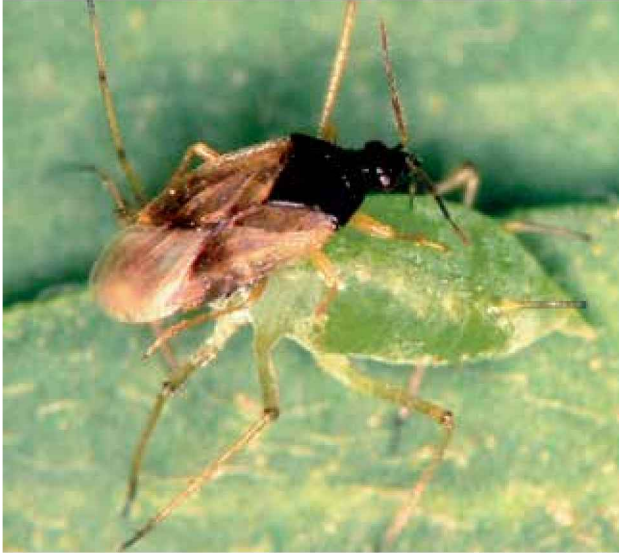
Antocórido adulto ( Orius sp.)