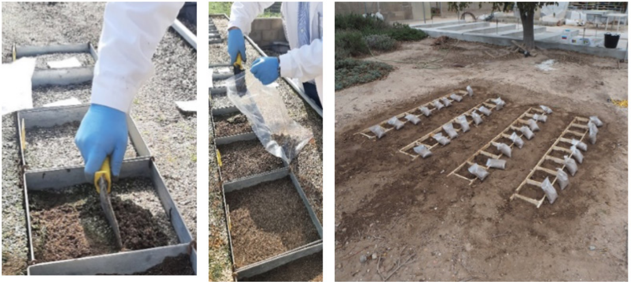
Figura 2 - Siembra de las semillas en una parcela experimental.

Durante los conteos, se eliminarán las plántulas nacidas a excepción de tres de cada repetición, que se dejarán sin eliminar en el pico de emergencia. De estas plántulas se anotará su fenología mediante la escala BBCH (Meier, 2001) hasta alcanzar las 10 hojas verdaderas, considerando ese estadio como el límite para la aplicación eficaz de medidas de control. Se procurará alterar el suelo lo mínimo posible así como evitar que queden restos de plántulas que puedan rebrotar. Con anterioridad al conteo, se realizará una fotografía a cada marco durante al menos el tiempo de anotaciones de la fenología. Estas fotografías podrán ser utilizadas para buscar una relación entre el número de píxeles y número de plántulas y para relacionar el crecimiento con la escala BBCH.