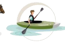
Actividades náuticas fluviales o de pantano