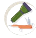
Supervivencia con alimentos silvestres y vivac sin equipamiento