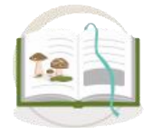
Reconocimiento de especies, hábitats e interacciones