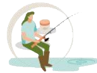
Pesca sin muerte