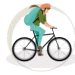
Rutas BTT interpretadas Con alquiler de equipos