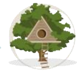
Casas de árbol