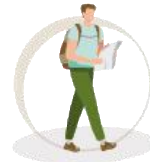
Rutas senderistas interpretadas