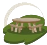
El bosque accesible con zonas adaptadas