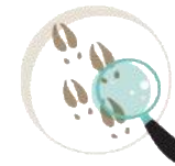
Interpretación de huellas, estrellas, rasgos geológicos