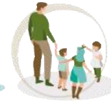
Talleres de ocio y entretenimiento