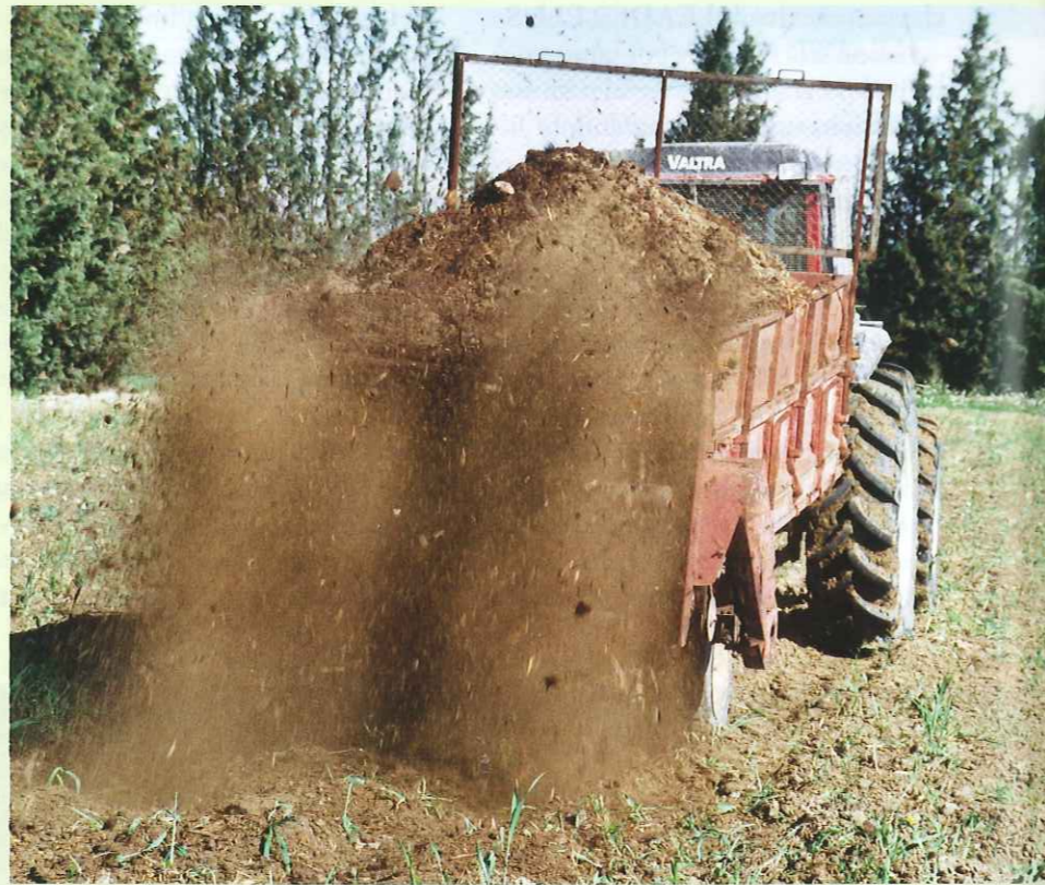
Estiércol. El ajuste y la dosificación del abonado mineral u orgánico son fundamentales para la fertilización.

El objeto del presente artículo es transmitir de un modo resumido las reflexiones que nos planteamos al finalizar ese breve estudio teórico sobre la situación global del balance de nitrógeno de fuentes agrarias en nuestra comunidad. La contaminación, en breves palabras, reside en el hecho de que una parte importante del nitrógeno, aportado al suelo como fertilizante, puede ser lavado y arrastrado a las aguas subterráneas o superficiales, haciéndolas no potables para el aprovechamiento humano o provocando la eutrofización en ríos o en lagos; pero también en que el excedente nitrogenado puede derivar en otro tipo de afecciones medio ambientales sobre los suelos o la atmósfera.