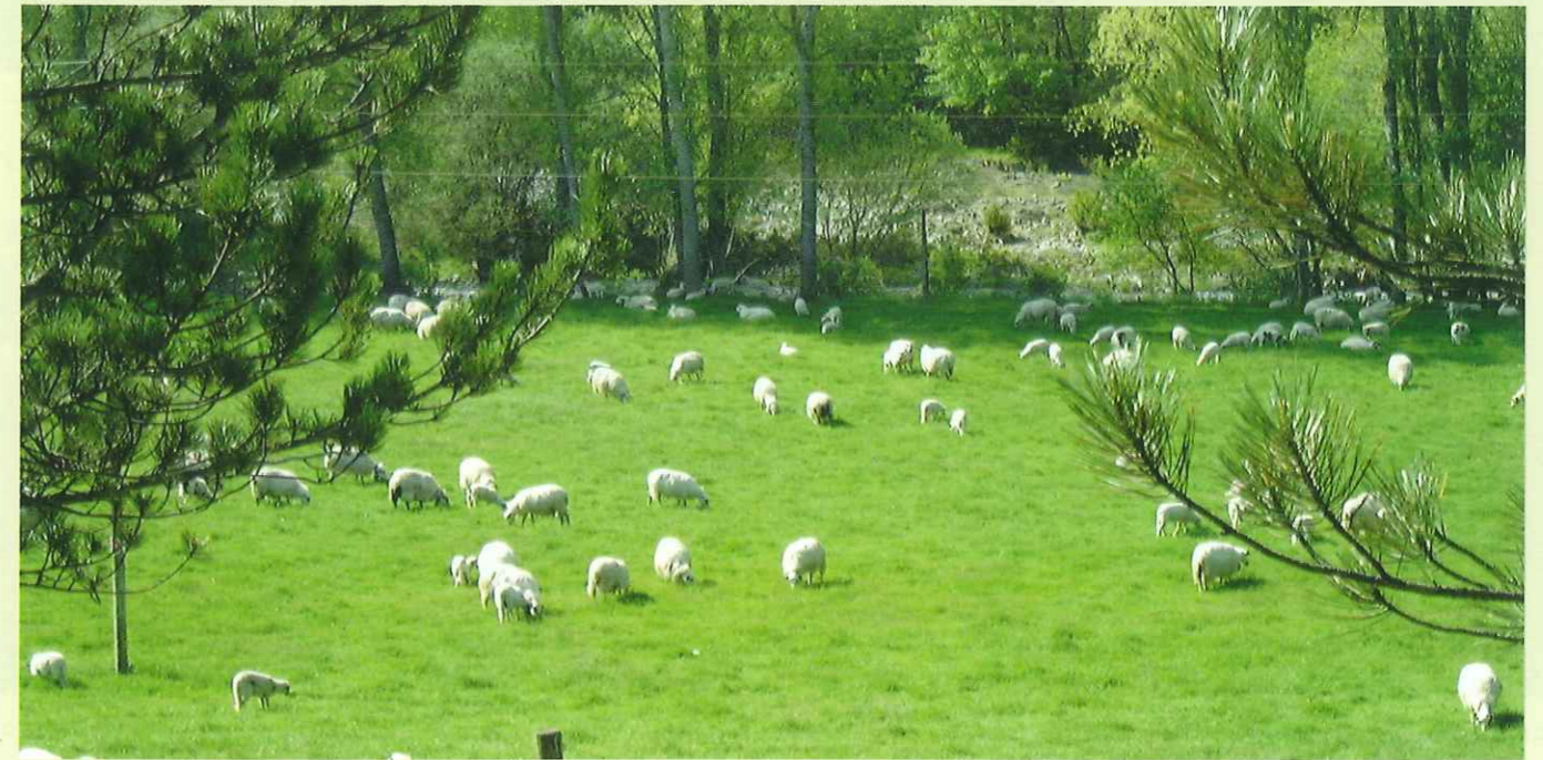
Tierra-ganado. El desarrollo de la ganadería y una buena definición del equilibrio en la producción de estiércol son unas buenas prácticas agrarias.

Es importante resaltar que existe una serie de prácticas de manejo sencillas que, independientemente de las situaciones anteriores, pueden ayudar en gran medida a disminuir las pérdidas de nitrato por lixiviación y que son: