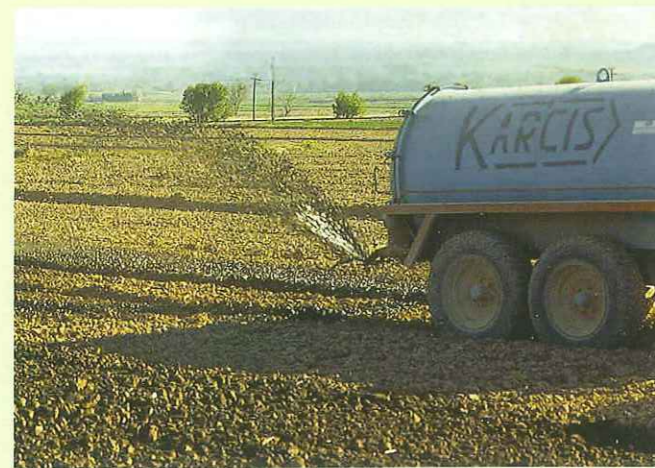
Mayor volumen. Los estiércoles de porcino pueden suponer mayor volumen de tipo orgánico.

Ante esta situación, ¿sería más razonable reconducir la situación mediante la prohibición de instalación de nuevas ganaderías en las zonas con sobrecarga, o incluso de reducirla