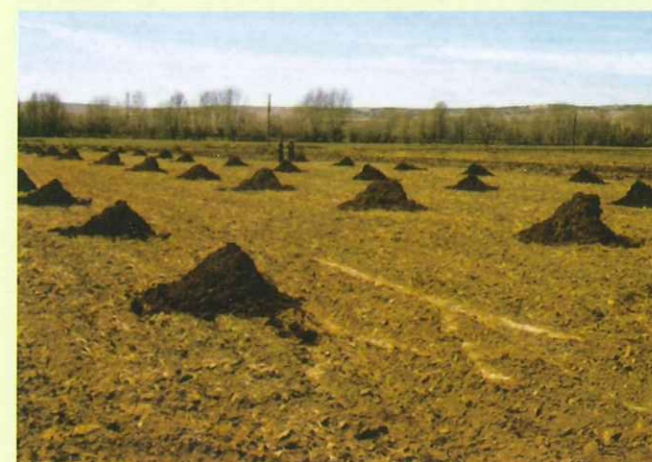
Cantidad. La mayor o menor cantidad de materia orgánica en el suelo debe ser ajustada a las necesidades del cultivo.

En última instancia, se centraría en la respuesta a la siguiente cuestión: los sectores interesados en la intensificación de la densidad ganadera ¿están realmente dispuestos a asumir y pagar los riesgos sanitarios o medioambientales que dicho modelo de producción plantea?