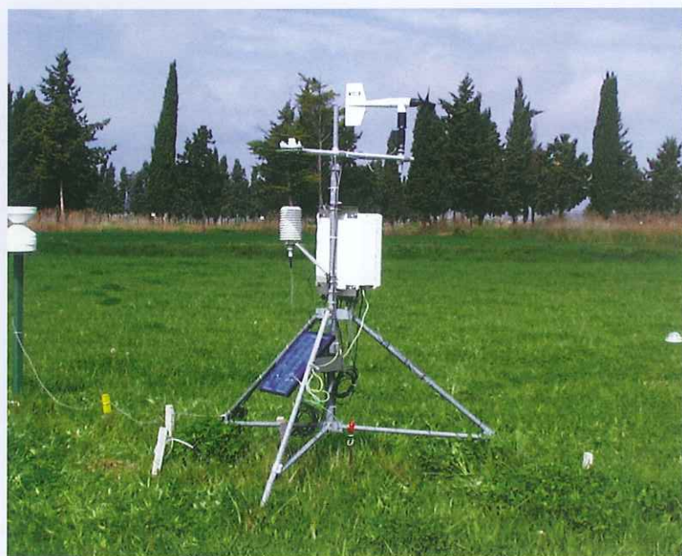
Estación meteorológica. Estación meteorológica automática para determinar las necesidades de riego.

de Aragón, los sistemas de riego más empleados, así como sus ventajas y limitaciones.