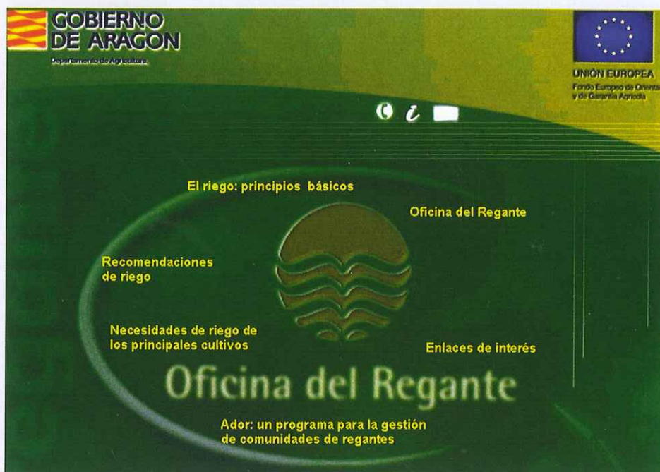
Entrada. Página de entrada a la web de la Oficina del Regante.